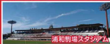
浦和駒場スタジアム

三菱重工浦和レッズレディースが本拠地とする浦和駒場スタジアムをはじめ、こども相撲大会が行われる相撲場など、スポーツとレクリエーションの場として利用されています。