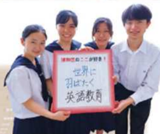
市立浦和高等学校 インターアクト部