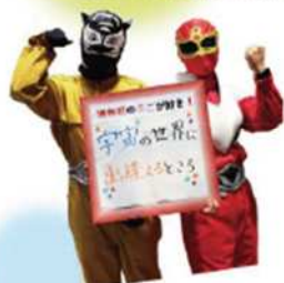
青少年宇宙科学館 サイレンジャー

大正時代になると、浦和には多くの芸術家や文化人が移り住み、「鎌倉文士に浦和画家」とも言われ、こうした歴史から浦和には文化施設が多く、「地域ゆかりの作家」と「本をめぐるアート」をコレクションの柱としている「うらわ美術館」、臨場感あふれる解説が特徴のプラネタリウムが自慢の「青少年宇宙科学館」、浦和駅前には蔵書数豊富な「中央図書館」があり、気軽に芸術・文化に触れることができます。