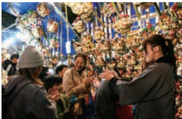
▲福を求める多くの方で賑わい、威勢のいい掛け声と手締め （にぎ） の音が響き渡りました