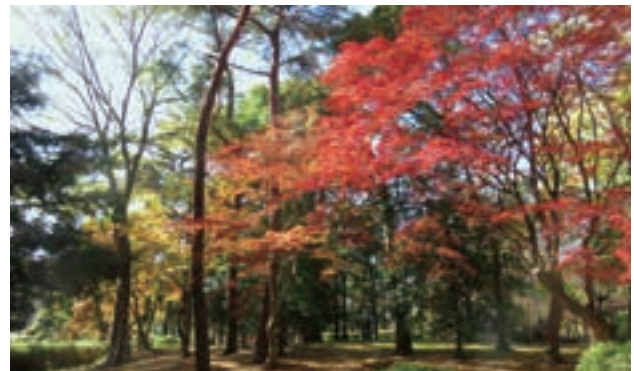
▲大宮公園(大宮区高鼻町)