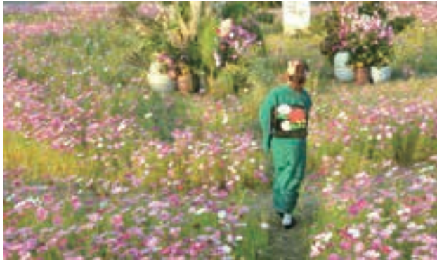
▲コスモス畑(岩槻区鹿室)

市公式Instagram(@saitamacity_official)でも、ボラカメさんが撮影した写真を紹介しています。