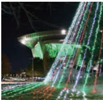
▲埼玉スタジアム2002公園(緑区美園)