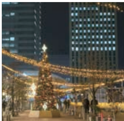
▲さいたま新都心駅東口