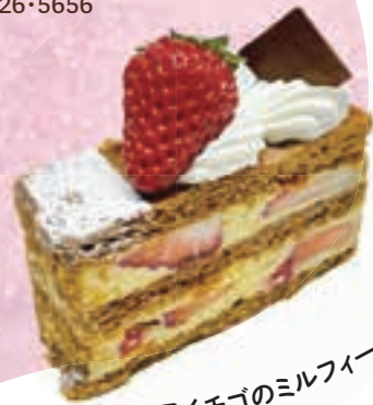
美園いちごのミルフィーユ