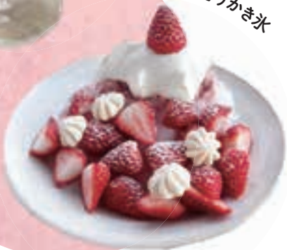
いちご狩りかき氷