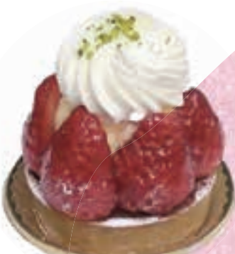
美園いちごのタルト