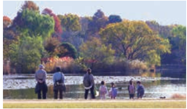
▲見沼自然公園(緑区南部領辻)