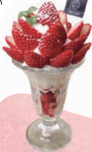
レアベリー苺のパフェ