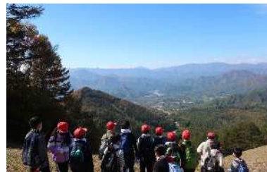
館岩少年自然の家での自然体験活動