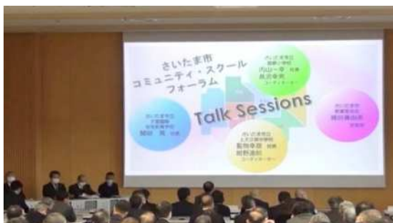
コミュニティ・スクールフォーラムの様子

急速な人口減少と少子化、家族形態の多様化などにより、地域社会の構造が大きな変化を迎えようとしている中、地域が学校を育て、学校が地域を育てる、学校を核とした持続可能なスクール・コミュニティの構築が求められています。そのため、学校と地域が連携・協働して未来を担う子どもたちをはぐくむコミュニティ・スクールの一層の充実を図ることが重要です。また、子どもたちの他者との関わりを多様な活動を通じ充実させ、子どもたちが主役となる教育活動を実践していくことで、地域の一員としての当事者意識をはぐくんでいくことも必要です。