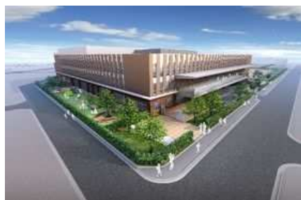
生涯の学びの拠点となる 良好な教育環境の整備を実施 (新設大和田地区小学校完成予定図)