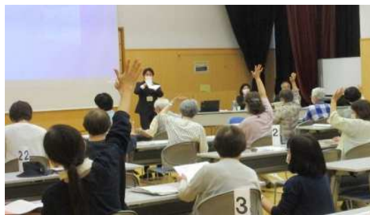
さいたま市民大学の様子