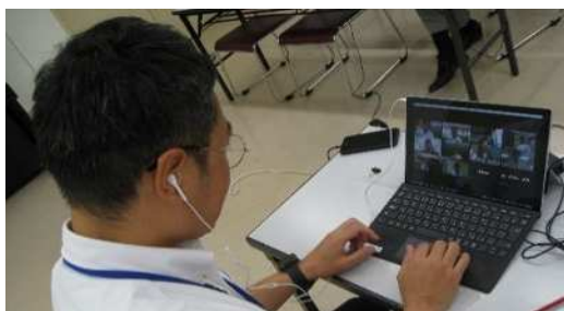
オンラインを活用した研修の実施

そのため、学校施設においては、学校規模の適正化や老朽化対策、施設の長寿命化等の環境整備を図ることで社会環境等の変化に対応することが重要です。また、教職員のライフサイクルの変化を踏まえつつ、多様な専門性を有する質の高い教職員集団を形成するためにも、人材確保や、働き方の見直し、地域人材を活用した部活動環境の構築など、持続可能な教育環境をつくることも必要です。