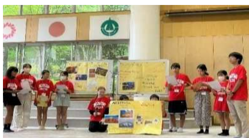
「グローバル・スタディ」の推進 ～『さいたま市イングリッシュ・キャンプ』の様子～

加えて、不登校等で長期欠席をしている児童生徒に対して、学ぶ楽しさや喜びを実感できる機会を提供するなど、不登校等児童生徒の社会的自立に向けた支援も必要です。