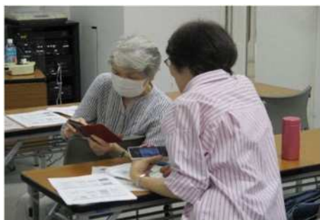
公民館「スマホ活用講座」の様子

そのため、生涯を通じて学べる環境と、人々が生きがいを持って社会に参画し、地域コミュニティの維持・活性化へ貢献できる仕組みを整えていくことが重要です。さらに、生涯学習関連施設で実施する講座を一層充実していくとともに、知識の習得のみならず仲間と交流する機会の獲得等、新たな時代に即した学びを可能とする施設の実現が必要です。