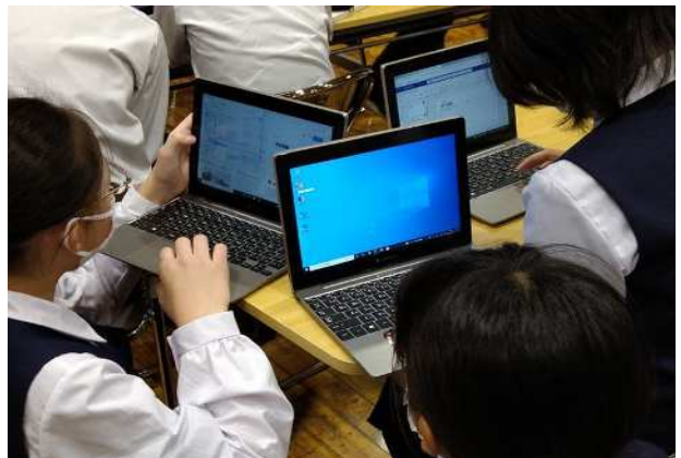
1人1台の情報端末を活用した思考場面