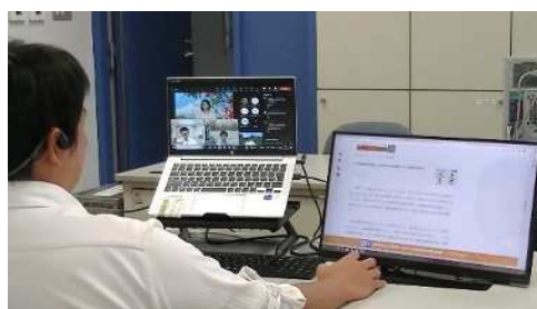
不登校等児童生徒への オンラインによる学習支援