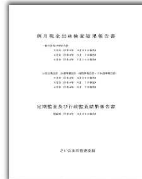
例月現金出納検査結果報告書 定期監査及び行政監査結果報告書