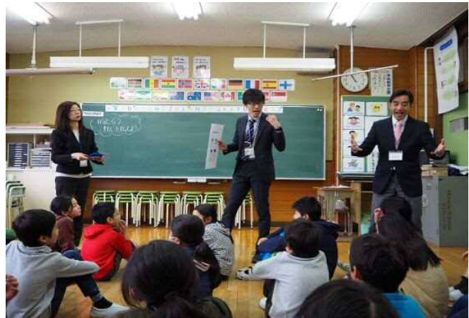
グローバル・スタディの更なる推進