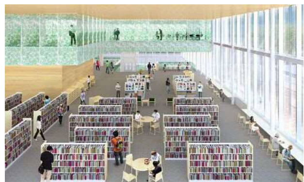
令和元年5月 大宮図書館の移転