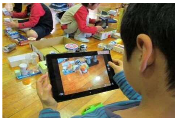
タブレット型コンピュータの配置等によるICTを活用したアクティブ・ラーニングの推進