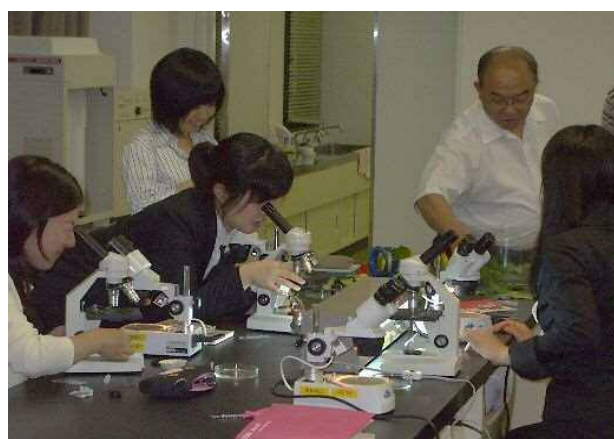
『教師力』パワーアップ講座の開催