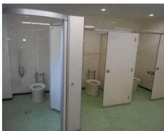
学校トイレの洋式化等の推進

新しい教育課程の実施を見据え、「社会に開かれた教育課程」の実現等による質の高い教育の提供のためには、教職員の働き方改革も含めた、学校の指導体制を構築していく必要があります。また、子ども自身に危険を予測し、危険を回避する能力をはぐくむような実践的な安全教育を推進するとともに、老朽化している学校施設に対して計画的、総合的な対策を実施し、施設の長寿命化を図り、着実に教育環境を整備していくことが重要です。