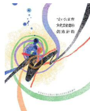
【文化芸術都市創造計画】