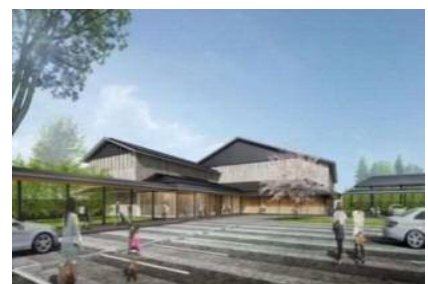
【岩槻人形博物館 外観イメージ】