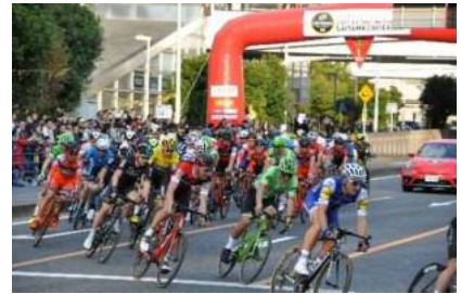
【ツール・ド・フランスさいたまクリテリウム】

本市の特色ある地域資源である人形を活用し、人形文化の振興を図るとともに、観光振興等にも寄与するため、平成32年2月の開館に向け人形文化の拠点施設として岩槻人形博物館の整備を進めていく必要があります。