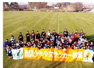
西区少年少女サッカー教室

西区は自然環境に恵まれていることに加え、三橋総合公園や大宮花の丘農林公苑など、特色ある公園が多く存在しています。これらの自然を生かすとともに、古くから伝わる伝統芸能の継承、区内にクラブハウス・練習場がある大宮アルディージャなど、地域資源を活用したまちづくりに取り組む必要があります。