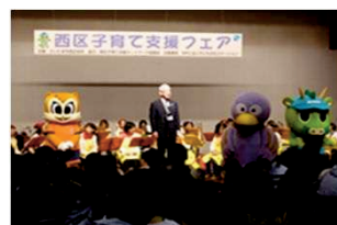
子育て支援フェア

親の子育ての不安などを軽減するためには、区内にある子育て支援機関が連携を深め、子育て中の親子の交流の場を提供し、育児相談や子育て支援情報の提供など地域に根ざした子育て支援体制を構築することが必要です。