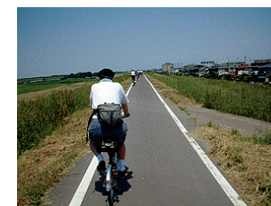
荒川サイクリングロード