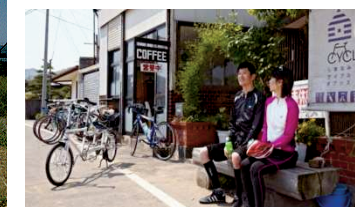
サポート施設のイメージ