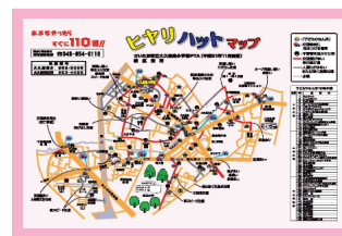
ヒヤリハットマップ