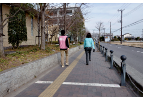
さくらふれあいロード