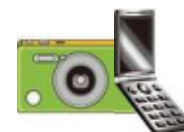
使用済携帯電話など

レアメタル(希少金属)の国内循環に寄与するため、小型家電のリサイクルを推進し、「もえないごみ」の減量を図るとともに、処理施設の管理費を軽減