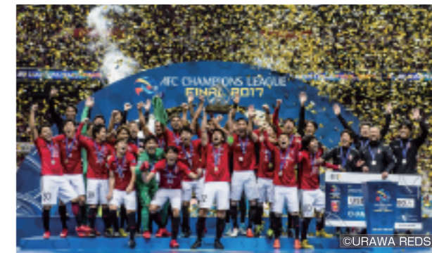
ACL2017優勝を果たした歓喜の瞬間