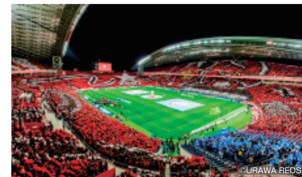
約5万8千人が一体となったコレオグラフィーは圧巻