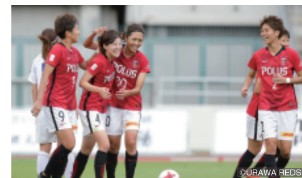
強く、美しいサッカーで魅せるレディースは、サッカーのまちの華