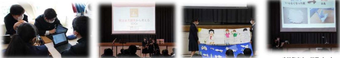
SDGs 卒論発表会の様子 (R4)

SDGsの目標達成は2030年。あとわずか7年しかありません。少しでも早く地球市民としての自覚と行動に繋げるために、SDGsを軸に総合は3年間を見通したカリキュラムマネジメントをしています。義務教育のゴールとして、3年生ではSDGsをテーマに1人ひとりが『卒業論文』を作成します。これから生きる子どもに生きて働く力の育成とICTの推進校であるメリットを生かし、1人1台タブレットを活用して、パワーポイントでの卒論発表会を行っています。2年生ではキャリア×SDGsでの取組を、1年生は、日常の“身近なSDGs”を取り上げて、多様な発表方法で、自分でテーマ・学習計画を立て、学びを調整しながら“私のSDGsプレゼン発表会”を行う予定です。