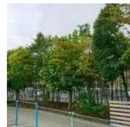
校庭南側のじょうほくの森 (R2年度)

平成22・27年度に、全学年の児童・保護者により、潤いのある環境づくり、防災を目的として、シラカシ、スタジイ、タブノキなどの常緑広葉樹を中心に、クチナシやヤツデなど29種類、3653本の苗木を植樹しました。当時小さかった苗木も十分な高さに育ってきました。これから様々な学習の場面で「じょうほくの森」を活用していきます。