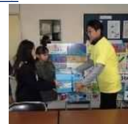
集まった文房具等を渡す様子 (R元年度)

NPO 法人 SB.Heart Station の外国の子どもたちに、靴や文房具を送る取組に協力しています。提供品募集の中心は4年生。全校に呼びかけたり、ポスターを制作し掲示したり、仕分け作業を行ったり、毎年熱心に取り組む姿が見られます。グローバル社会の一員として、国際協力活動を体験したり相手国のことを調べたりすることを通して、共に支え合う世界の実現に向けて自分のできることを考える姿勢をもてることを目指しています。