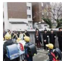
中学生と合同のあいさつ運動 (R元年度)

正門前を「あいさつ通り」と名付け、あいさつ運動を推進しています。児童会運営委員が立ってあいさつをしたり、例年中学生と一緒にあいさつを行う期間を設けたりしています。また、いじめ撲滅を目指して、ハートフル集会を計画し全学級でスローガンを発表したり、いじめ撲滅の木を育てたりしています。全校児童が安心して学校生活を送れる温かな学校づくりを進めています。