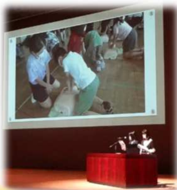
ASUKAモデルフォーラム