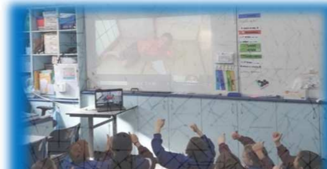
国際ジュニア大使 オンラインで日本文化を紹介