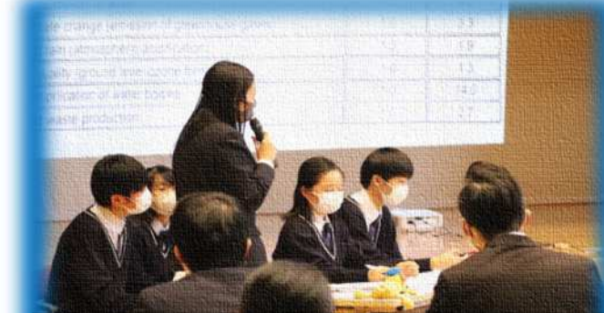
ディベート大会 熱心に意見を述べる生徒