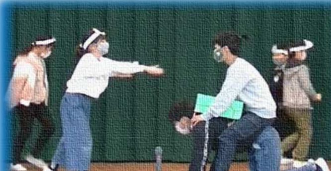
英語劇 浦島太郎を演じる小学生