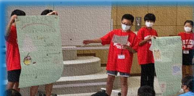
イングリッシュ・キャンプ 英語でのプレゼン