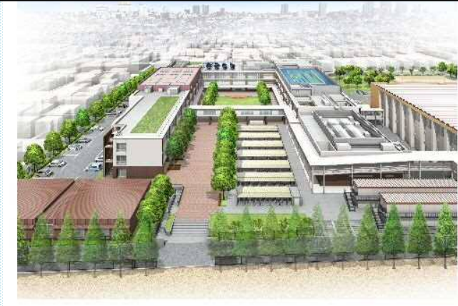
大宮国際中等教育学校

教員免許状の所有状況等を考慮して、中学校 のみならず、中等教育学校、高等学校の教員 として採用します。