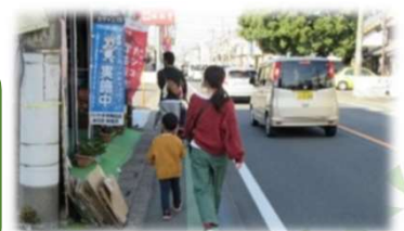
本町通りを親子並んで歩く様子 (安心して歩きたくなる沿道空間の例)