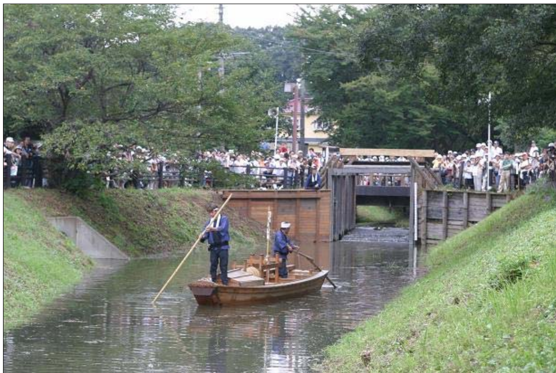
見沼通船堀(開閉実演)

また、氷川女體 にょたい 神社、見沼通船堀、南部領辻の獅子舞など、歴史や文化を伝える景観資源が多く残されています。