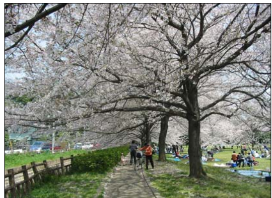
見沼代用水西縁の桜