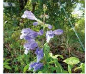
ラショウモンカズラ