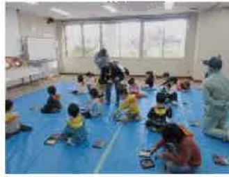
③ストラップ・コマ作り